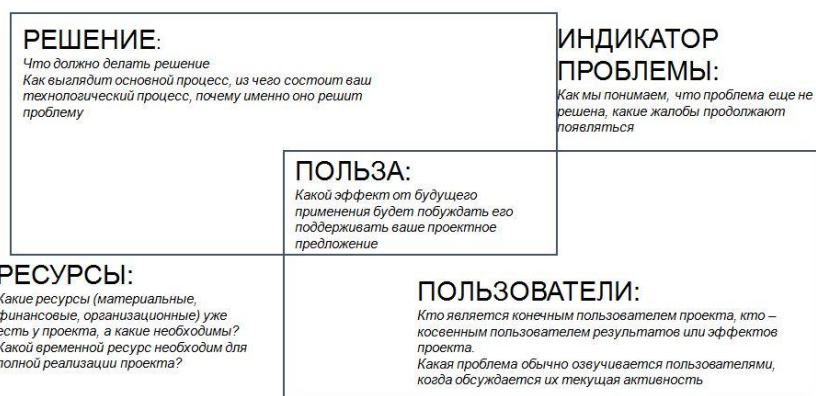
Рисунок 1 – Описание проектной практики

Для введения первокурсников в проектную деятельность мы познакомили их с моделью создания проекта «Описание проектной практики», состоящую из пяти основных этапов (рисунок 1).