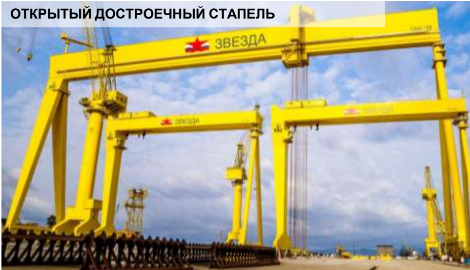
ОТКРЫТЫЙ ДОСТРОЕЧНЫЙ СТАПЕЛЬ